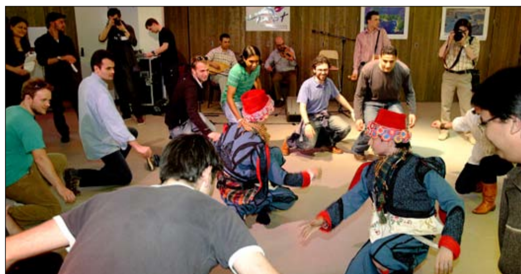
Crouching low to the ground with arms spread, people circle around the folk dancers to follow their steps of the just-learned Zeybek.