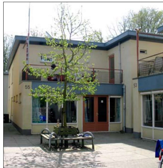
Campuslaan 55.