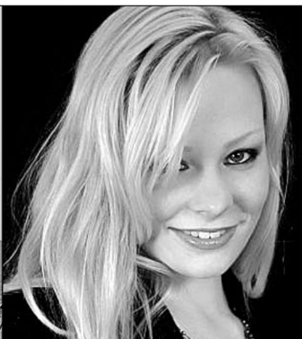
Alia Spit (TCW)