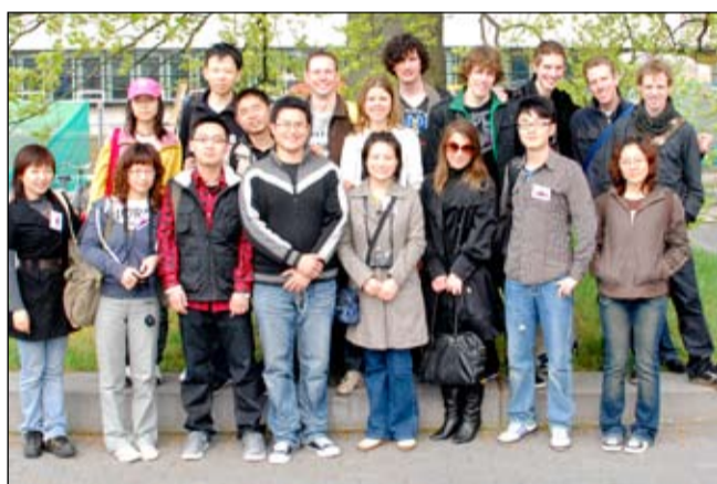
Chinese and Dutch students participating in first Industrial Design Exchange tour the campus.

Apart from culture, there are educational differences. 'The Chinese students are educated in architecture or graphic design, while the Dutch students are industrial designers. Because of our different academic backgrounds and cultures, I hope we will be able to learn a lot from each other and broaden our mutual views on designing for our future professions,' says Rick Schotman, a Dutch master's student who will travel with