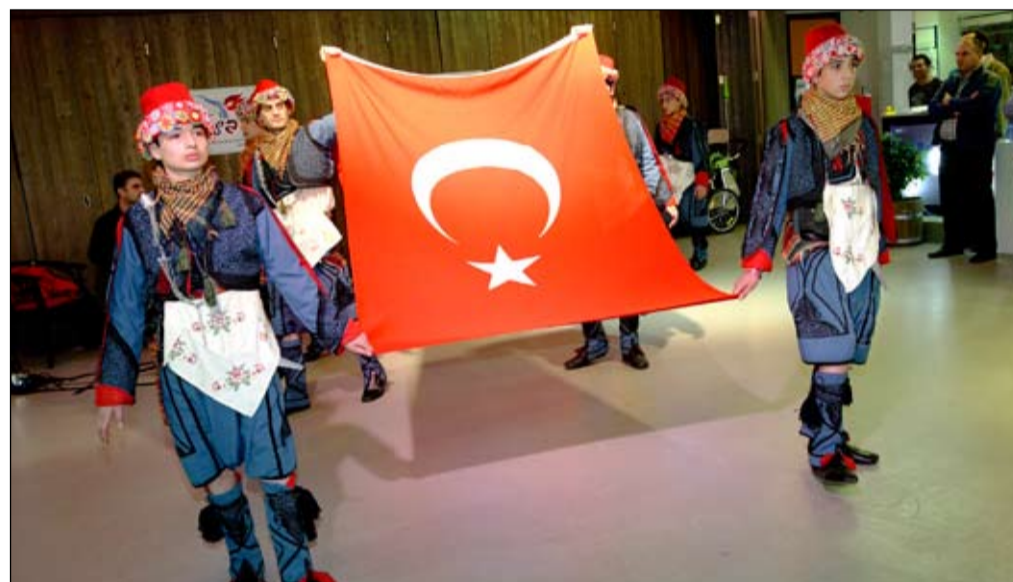
Dancers from the Almelo Zeybek Folk Dance group carry in the Turkish flag while a traditional poem was being read in Turkish, opening the night's performances.