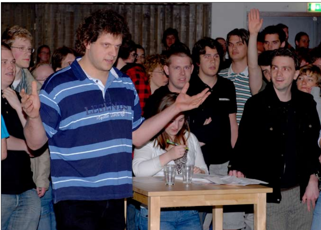
Studenten trokken in het huisvestingsdebat fel van leer richting CvB.