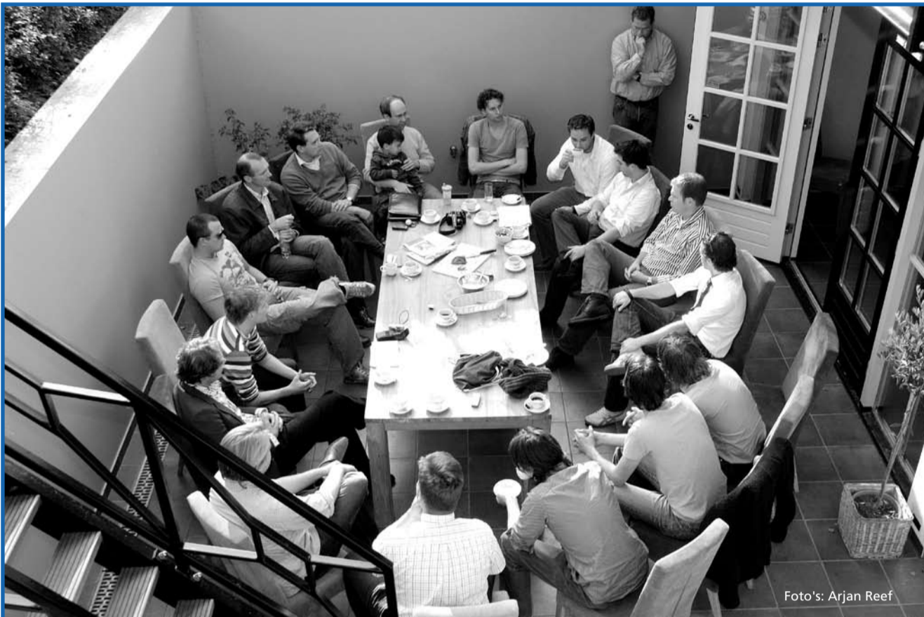
Bewoners en oud-bewoners van Huize Hubertus in vergadering bijeen.