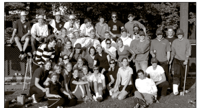
Deelnemers van Psycho.

bij de mannen gewonnen door het dispuut Yunophiat, dat Cnødde overtuigend klopte met 21-8. De dames waren meer aan elkaar gewaagd. Want Spooky klopte Poison uiteindelijk met een krappe 11-10, waarmee Spooky volgend jaar Psycho mag organiseren.