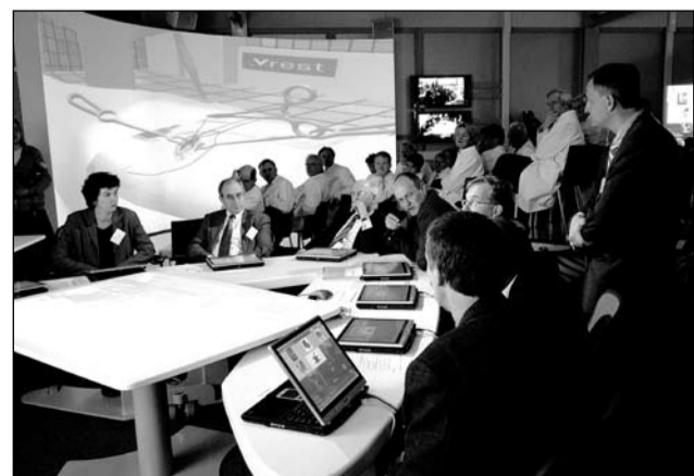
Archiefphoto van een experiment in de T-Xchange Cell.