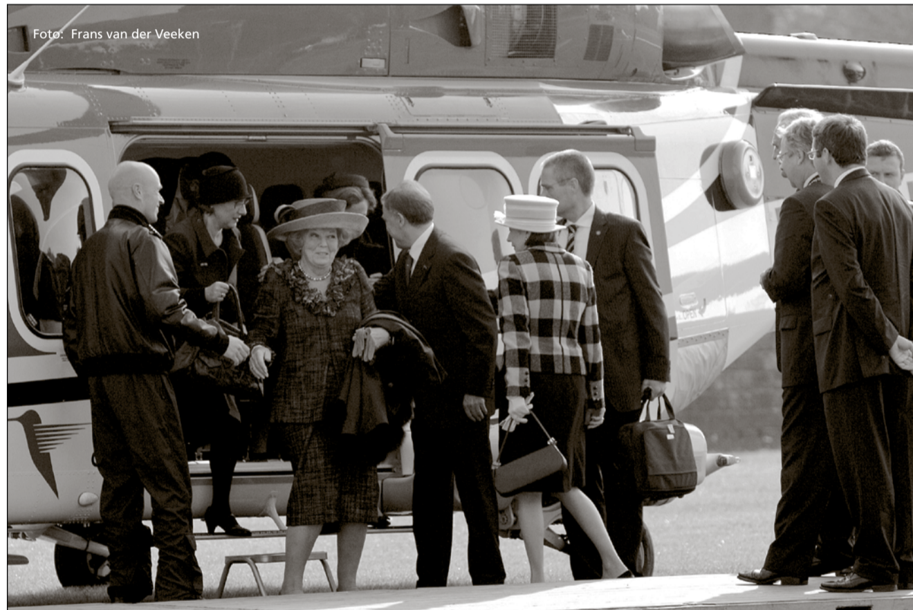
KONINGIN. Meer dan duizend belangstellenden waren er gisterochtend getuige van hoe drie ronkende helikopters op het Ganzenveld landden, met in het laatste toestel koningin Beatrix. In het kader van het staatsbezoek aan Nederland van de Duitse Bondsprezident Horst Köhler en zijn vrouw, bezocht het gezelschap vandaag de Euregio Twente. Op de UT spraken de koningin en haar gasten onder andere over de economische samenwerking in de grensregio. Daarna kregen zij bij MESA+ enkele korte presentaties over initiatieven op het gebied van nano-technologie.